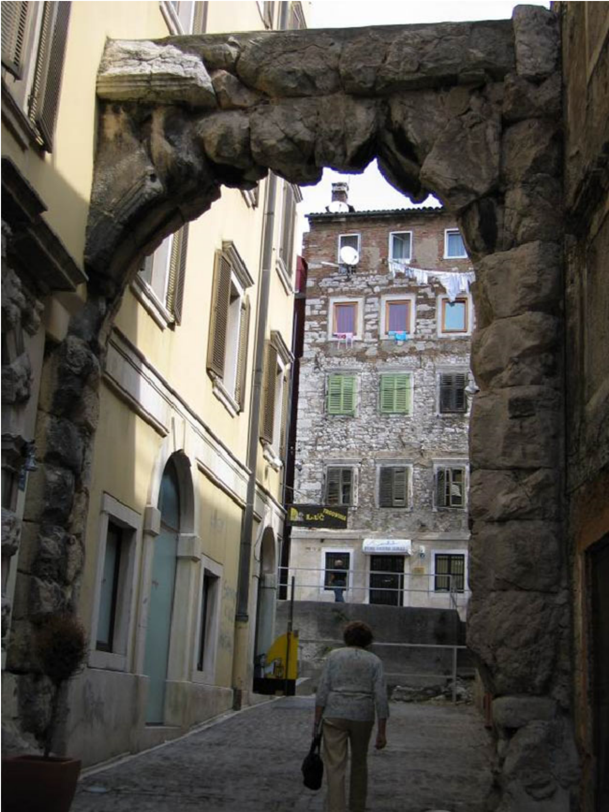
D'annunzio. Forse al Castello.