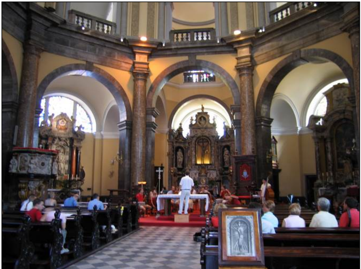
Si va a vedere la chiesa di San Vito. C'è un concerto. La chiesa a base ottagonale è 2006 - 15